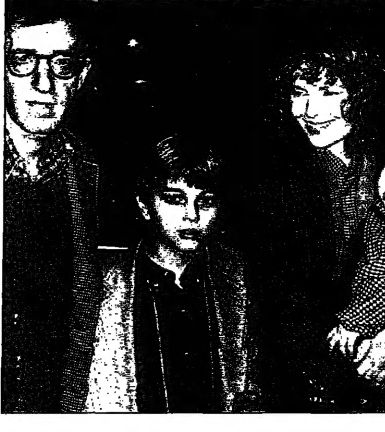
ميا فارو مع ودي ألان وبعض اولادها وتظهر الي اليسار سوني بي.

عاشت الممثلة الامريكية الشهيرة ميا فارو 12 عاما مع المخرج وودي ألان، ولم تكن تتفصل عنه سواء في الحياة او على الشاشة الا ان اكتشاف علاقته باثنتي للثبات، وعلى اثر ذلك الفضيحة انفصلت عنه، وقد عاشت هذه الممثلة منذ صغرها قصة حب رومانسية مع اللطب الامريكي الشهير فرانك سناترا، كتابها الاخير للعثون بالي ايجب ان انهب صخر بالفرنسية حديثا، لعيش الان وحيدة مع اولادها في سعاده غامرة ولا تريد العودة الى الماضي، في هذا الحوار تكشف عن سيرتها الحياتية، لماذا صر هذا الكتاب من اجل الاتهام الشرح ام التبرير؟